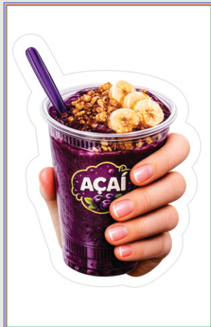
Página 1 (Layout)