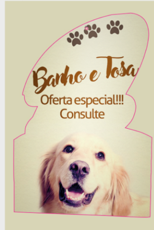
Verso do arquivo

Envie o verso da arte respeitando as linhas do gabarito.