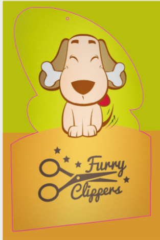
Frente do arquivo

Envie a frente da arte respeitando as linhas do gabarito.