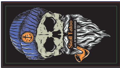
Página 1 (Layout)