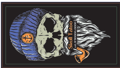
Página 1 (Layout)